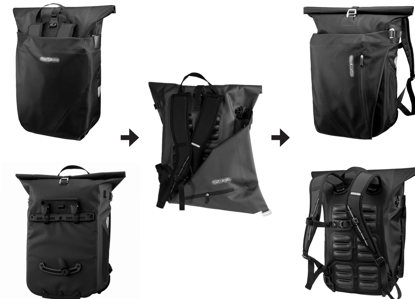
Sac à dos

Accessoires vendus separement: Anti-Theft-Device (E124), QL2 Lock (F3913)