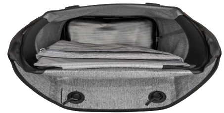
Vue intérieure avec laptop compartment