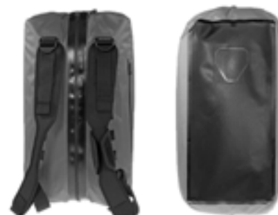
Symbole Reflektro sur le fond du sac