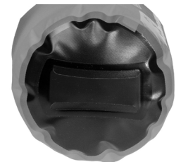
Bride à la base permettant de le tenir pour le vider et l'arrimer.